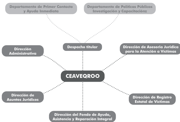
FIGURA 3: Estructura de la CEAVEQROO. Elaboración propia.

El Modelo Integral de Atención a Víctimas (MIAV) es el conjunto de procedimientos, acciones y principios fundamentales para proporcionar ayuda inmediata, atención, asistencia, protección y reparación integral a las víctimas del delito y de violaciones a derechos humanos, así como impulsar su empoderamiento y prevenir la revictimización y la victimización secundaria.