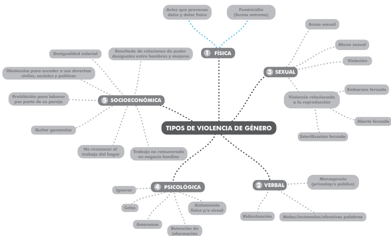
FIGURA 1: Tipos de violencia de género. Elaboración propia con base al glosario de ONU Mujeres.